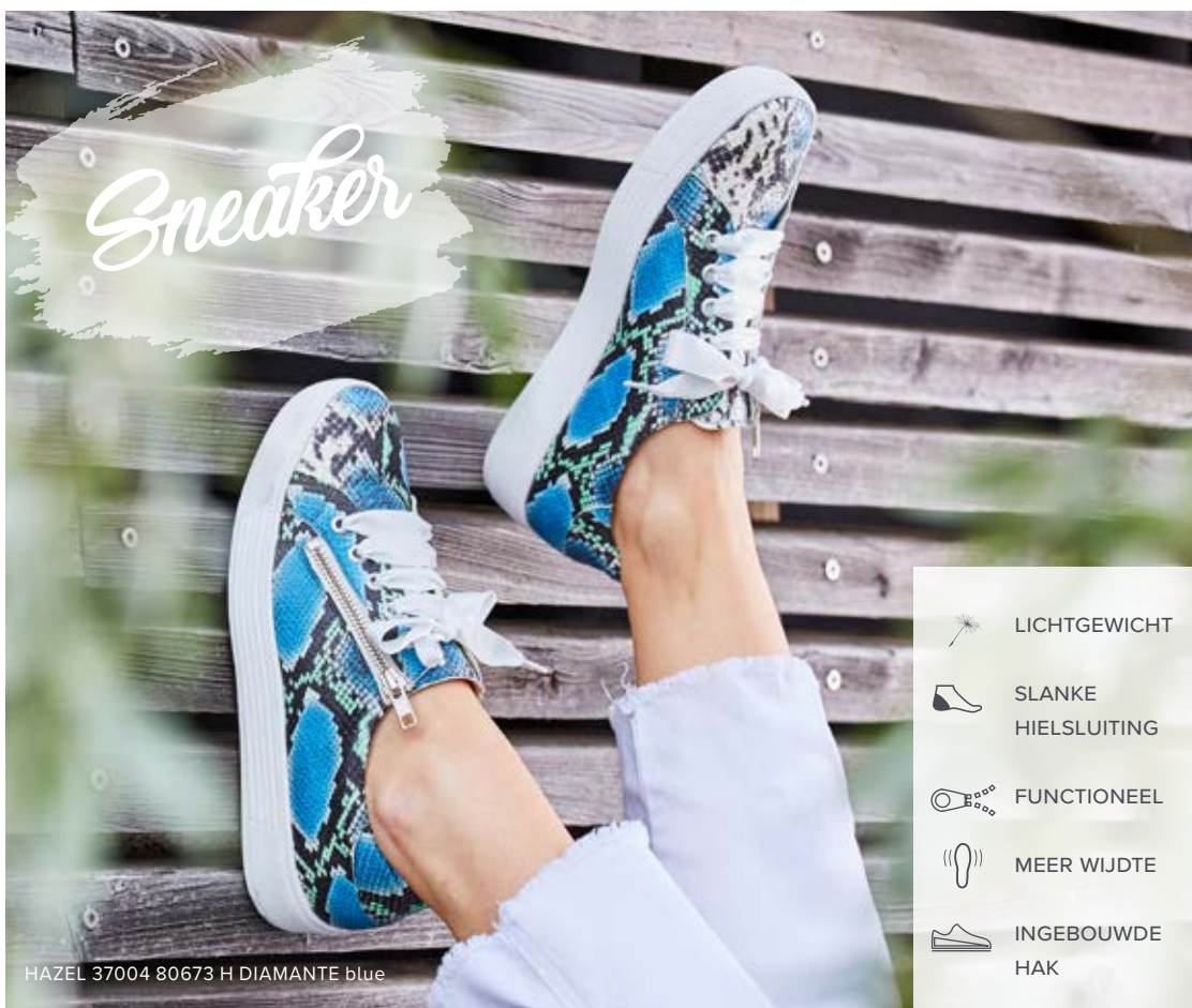
HAZEL 37004 80673 H DIAMANTE blue