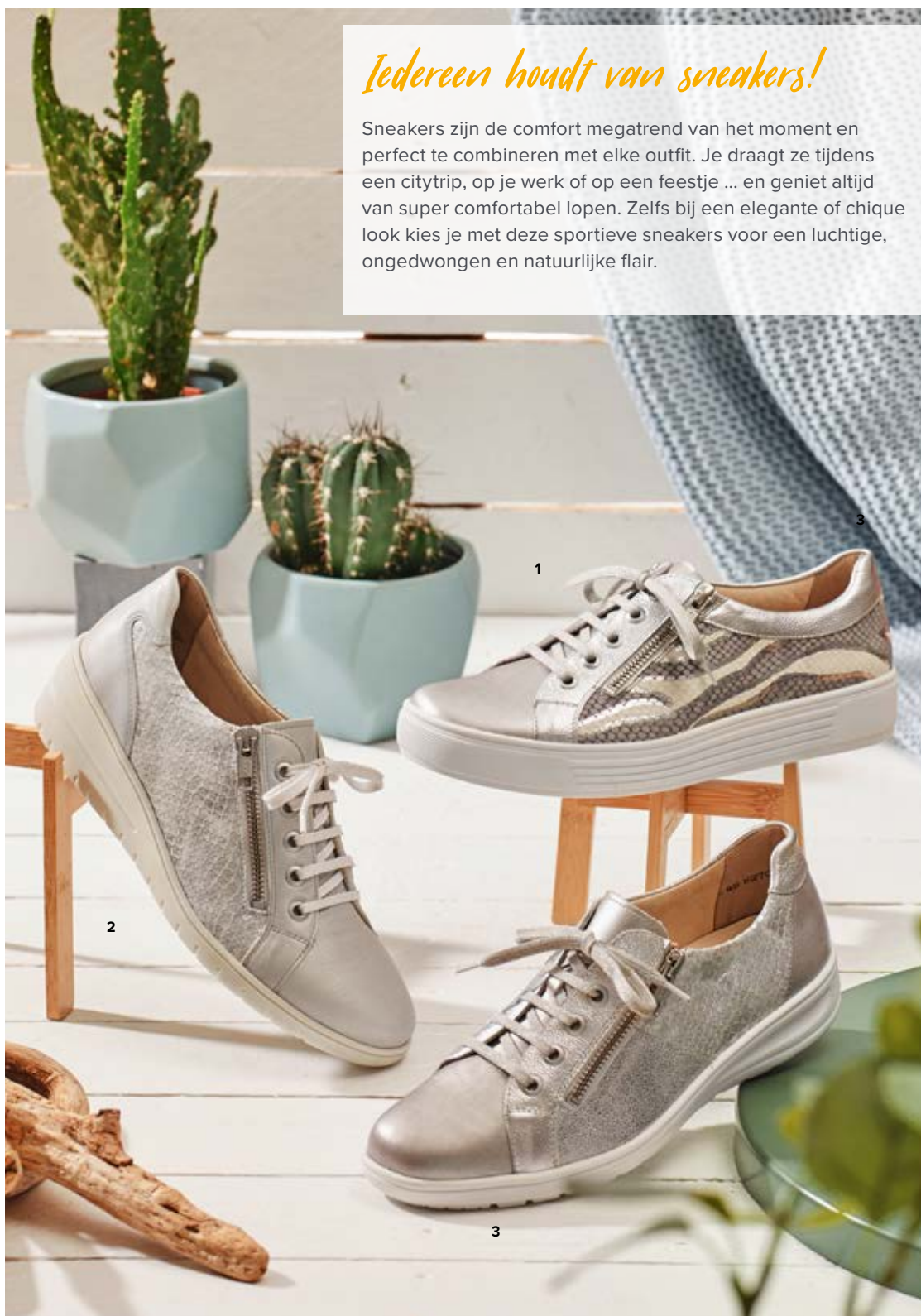
1 KAJA 32004 20651 K PERLCALF / GLORY / ROVER grey multi | 2 HELIA 25021 10073 H KERMIT / VIPER space / ice | 3 HEAVEN 27001 20650 H PERLCALF / GLORY / MARLEY / VIPER grey multi

Sneakers zijn de comfort megatrend van het moment en perfect te combineren met elke outfit. Je draagt ze tijdens een citytrip, op je werk of op een feestje ... en geniet altijd van super comfortabel lopen. Zelfs bij een elegante of chique look kies je met deze sportieve sneakers voor een luchtige, ongedwongen en natuurlijke flair.